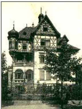
Villa Heinrichshof Wohnhaus der Familie Lahmann

Das Grab der Familie Lahmann befindet sich auf dem Waldfriedhof Weißer Hirsch.