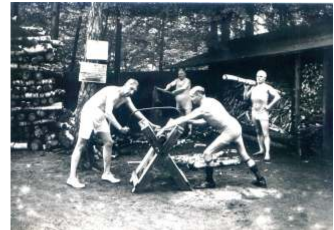
Auf ärztliche Anweisung! (um 1920)