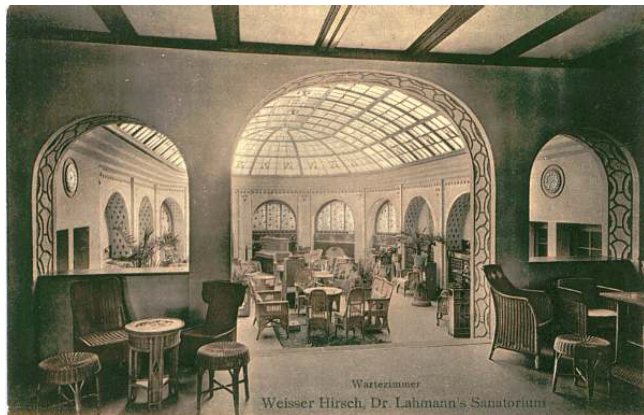
Wartezimmer Weisser Hirsch, Dr. Lahmann's Sanatorium